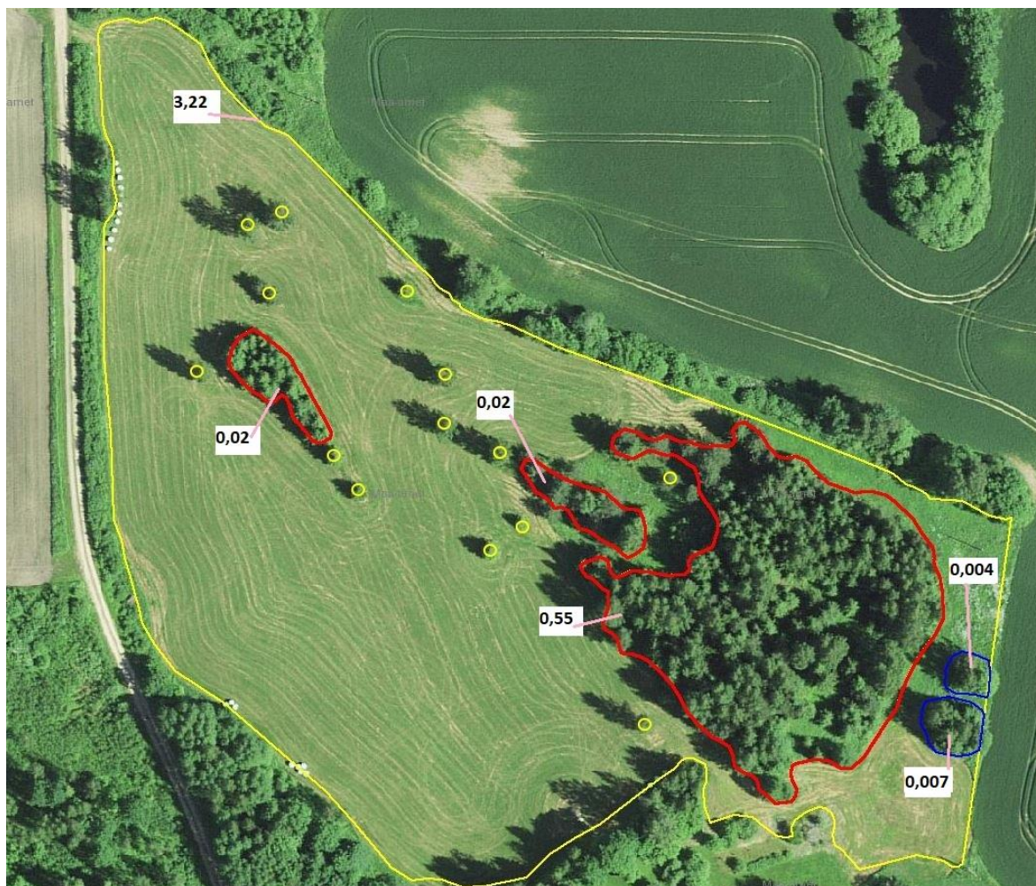
Joonis 1. Puudegrupid ja üksikud puud