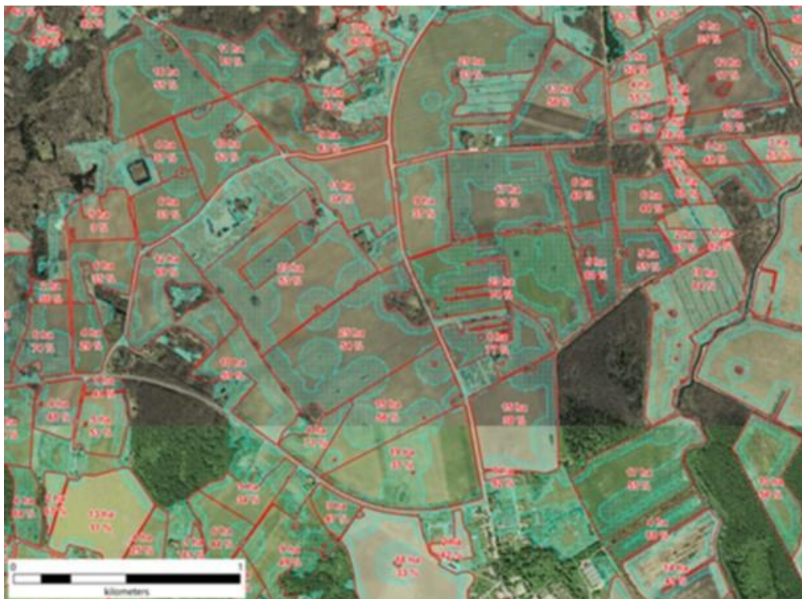
Joonis 1. Näide maastikuelementide mõjualade erinevatest katvustest erineva suurusega tootispõldudel mitmekesises põllumajandusmaastikus