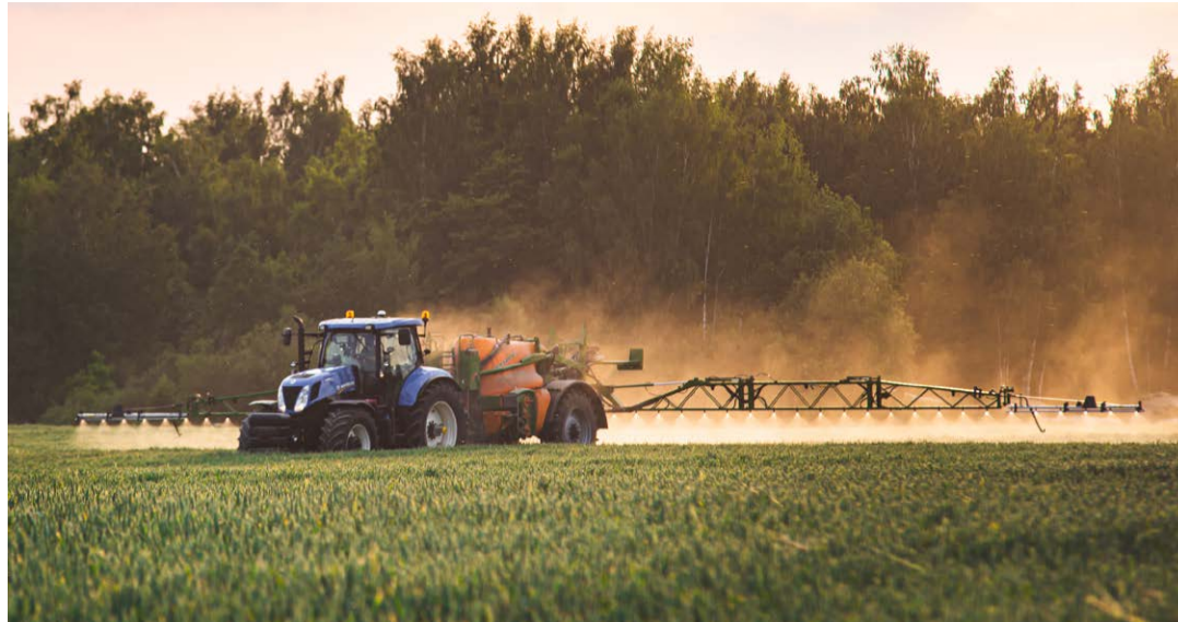
Maapiirkonnas majandustegevuse mitmekesistamise investeeringutoetuse taotlejatel on võimalik kasutada uue teenusena juhendamist, mis aitab taotluse esitamisel ning toob nende võimalused paremini esile.

LEADER meetmed. LEADER meetmel algab uus toetuste jagamise periood pärast seda, kui kohalike tegevusrühmade piirkondlikud strateegiad on ministeeriumis heaks