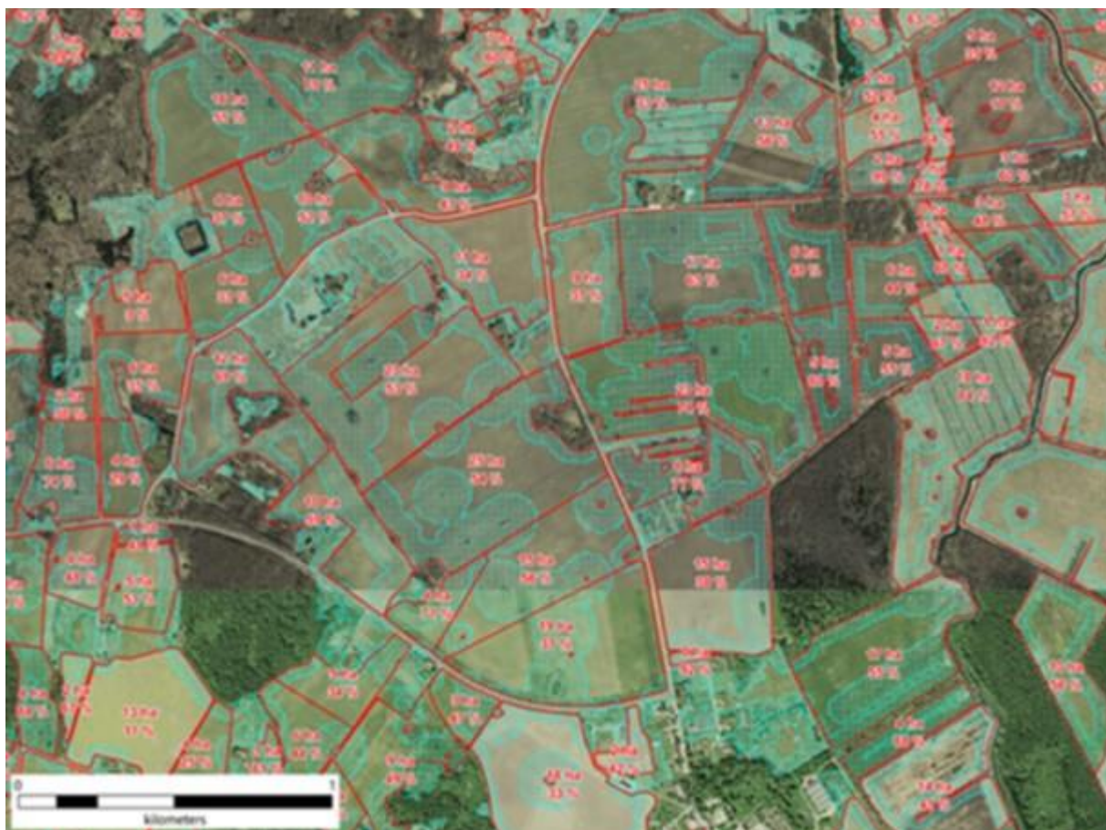
Joonis 1. Näide maastikuelementide mõjualade erinevatest katvustest erineva suurusega tootmispõldudel mitmekesises põllumajandusmaastikus