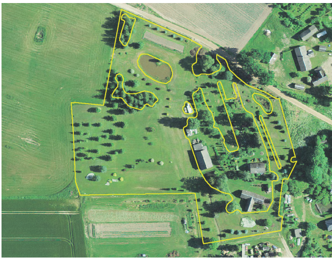
Iseloomulik näide, kus taotlusala pöld on esitatud hoovialale

Ka tänavu sai ca 900 taotlejat soovituslikku väiksema toetussumma põhjusel, et nad taotlesid toetust suuremale pinnale kui tegelik toetusõiguslik pind. Sellise olukorra vältimiseks tuleb taotlejal veenduda, et maa on võsast ka tegelikult puhastatud ja võsajäänused põllult eemaldatud. Lisaks tuleb jälgida, millistes piirides tegelikult maad haritakse. Toetusõiguslikud ei ole ka päikesepaneelidega kaetud alad ning hoovialad.