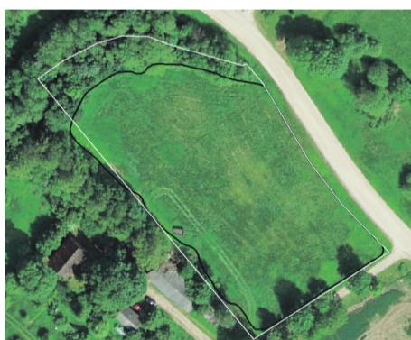
Iseloomulik näide, kus taotlusalune põld on esitatud võsase ala peale (valge joon – taotletud põllu piir; must joon – põllumassiivi tegelik piir)

Tänavu sai üle 700 taotleja soovitus väiksema toetussumma põhjusel, et nad olid toetust taotlenud suuremale pinnale kui tegelik toetusõiguslik pind. Sellise olukorra vältimiseks tuleb taotlejal veenduda, et maa on ka tegelikult võsast puhastatud ja võsajäänused põllult eemaldatud.