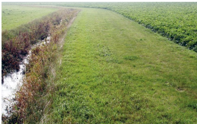
Puhverriba niitmine pole kohustuslik, vaid üks võimalusi.

Kui peakraav, kanal või maaparandussüsteemi eesvooluks olev kraav on Eesti topograafia andmekogu põhikaardile kantud joonobjektina, on puhverriba ulatuse arvestamise lähtejooneks süvendi serv.