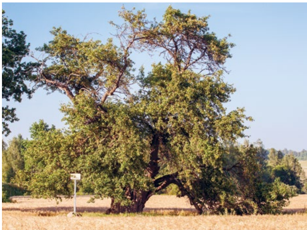
Oti metsõunapuu Viljandimaal.

Analoogne nõue on HPK nõudena kehtinud alates 2010. aastast, täpsustatud on konkreetsed looduse üksikobjektid, mis võivad põllumajandusmaal esineda.