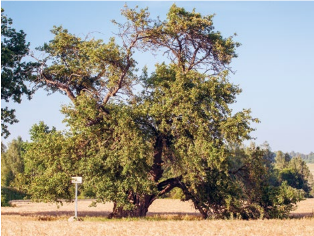
Oti metsõunapuu Viljandimaal.

Analoogne nõue on HPK nõudena kehtinud alates 2010. aastast, täpsustatud on konkreetsed looduse üksikobjektid, mis võivad põllumajandusmaal esineda.