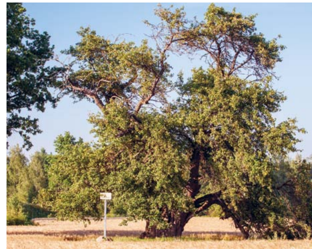
Oti metsõunapuu Viljandimaal.

Analoogne nõue on HPK nõudena kehtinud alates 2010. aastast, täpsustatud on konkreetse looduse üksikobjektid, mis võivad põllumajandusmaal esineda.