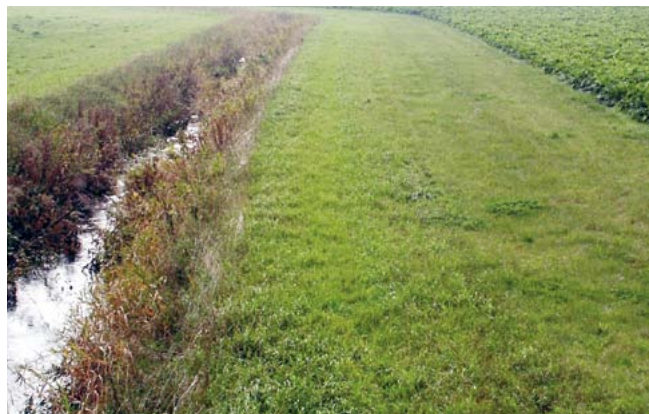
Niidetud puhverriba pole kohustuslik, vaid üks võimalusi.

Väetiseks loetakse ka kõik orgaanilised väetised, sh sõnnik. Maaparandussüsteemi eesvool on liigvee ärajuhtimiseks või vee juurdevooluks rajatud veejuhe või loodusliku veekogu reguleeritud lõik, millest sõltub reguleeriva võrgu nõuetekohane toimimine (Maaparandusseaduse § 3 lõige 7). Tavaline veepiir on Maa-ameti põhikaardil märgitud veekogu piir.