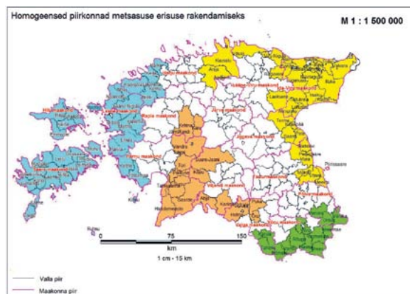
Homogeensed piirkonnad metsasuse erisuse rakendamiseks.

Täpsem info ja loetelu metsasuse erisusega hõlmatud homogeensetest piirkondadest ja nendes piirkondadesse jäävatest valdadest on leitav PRIA kodulehelt.