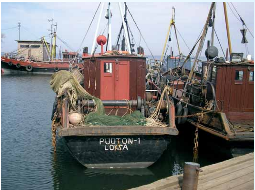
Traallaevu aitab toetus kaasajastada